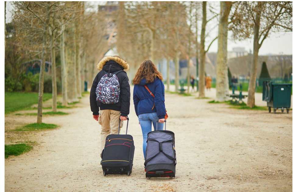
Wyjazd turystyczny, nawet za granicę, nie będzie już podstawą do odebrania zasiłku chorobowego